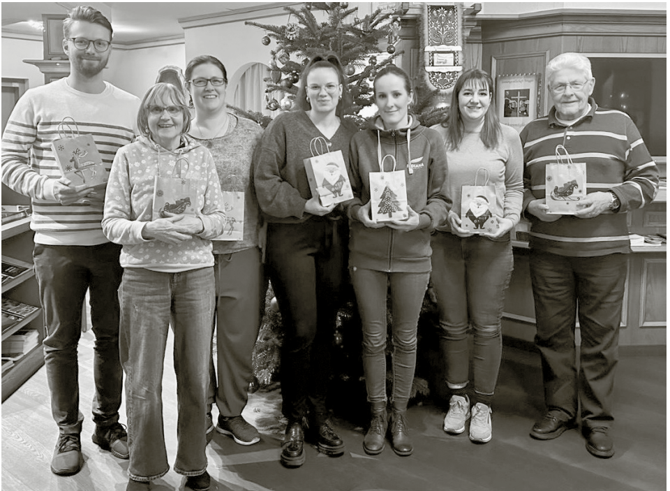
Die Vorstandsmitglieder nach der letzten Vorstandssitzung im 2024 mit ihrem wohlverdienten Weihnachtsgeschenk von der Präsidentin.