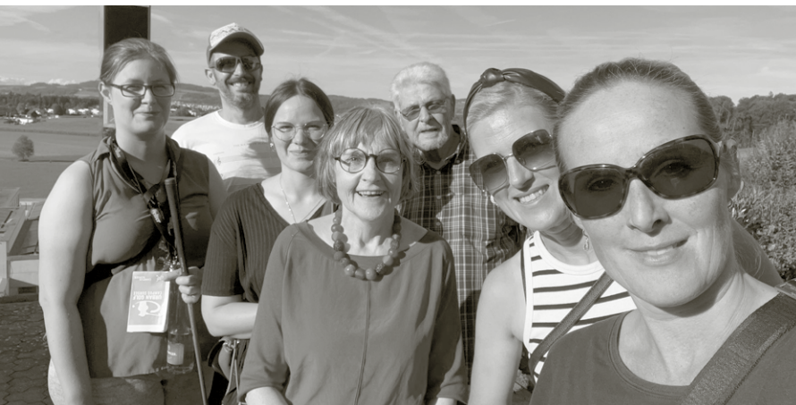
Der Vorstand des TSL am Ausflug beim Urban Golf auf dem Campus in Sursee.

Im Tierheim selbst wurde nicht nur gearbeitet, sondern auch gefeiert: Ein stimmungsvoller, vegetarischer Abend, gekocht vom Partner unserer